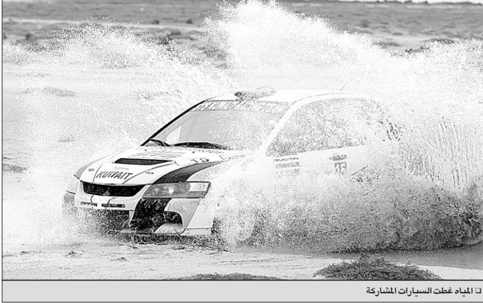
المياه غطت السيارات المشاركة